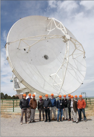
圖 2. 本院天文所 VLBI 團隊與 ALMA 「北美版」原型天線之合影。照片攝於 2011 年 4 月，在美國新墨西哥州索科羅。當時此天線已 3 年無人照管，研討會即就如何改造、重新啟用此座天線，使之可為「次毫米波 VLBI 計畫」所用加以討論。按索科羅會議結論，現在，2011 年 7 月，本院天文所已開始著手重新測試和檢查這支口徑寬達 12 米的天線碟之現況。