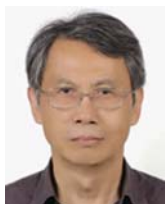
王明珂 1952年生 現職：中央研究院歷史語言研究所研究員 專長：歷史學、歷史人類學