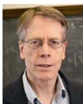
拉爾斯·彼得·漢森 現職：David Rockefeller Distinguished Service Professor in Economics, Statistics & the College, University of Chicago 專長：經濟學