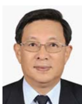
臧振華 1947年生 現職：中央研究院歷史語言研究所研究員、國立清華大學人類學研究所與中研院合聘教授 專長：考古學