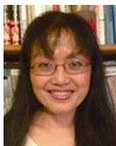
李惠儀 1959年生 現職：哈佛大學東亞語言文化系中國文學教授 專長：中國文學