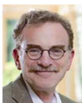
蘭迪·謝克曼 現職：美國加州大學柏克萊分校分子細胞生物學教授、美國加州大學舊金山分校生物化學和生物物理學合聘教授、美國霍華德休斯醫學研究所研究員 專長：細胞生物學