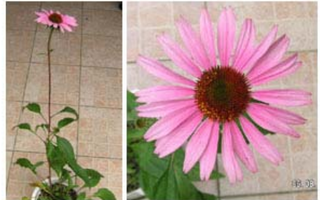
圖一：紫花紫錐菊 ( Echinacea purpurea ) 之外形圖。

紫錐菊 ( Echinacea spp.) 又稱紫錐花或松果菊，屬多年生菊科植物，原產地在北美洲中西部。長久以來，北美印第安人用於治療蛇蟲咬傷、感冒、喉嚨痛、發炎、病菌感染等症狀。後經科學證實，紫錐菊製劑能增強人體免疫力及對病毒及細菌的抵抗力。現在，紫錐菊產品多用於預防及治療感冒。近年來，紫錐菊相關產品一直是美國自助式藥局最暢銷的十大草藥之前幾名或榜首。舉例來說，2003 年紫錐菊產物在美國的年銷售量達 1.58 億美元，而全世界的產值更達 13 億美元。又由於紫錐菊的花形優美 (圖一)、花期又長，在歐美國家紫錐菊尚為一新興花卉。