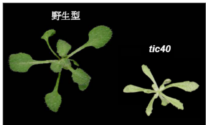
圖二 野生型阿拉伯芥與 tic40 突變株

為了驗證我們的假說，我們首先測試 Tic40 是否具有與 Tic110 結合的能力。利用 yeast two-hybrid 與 in vitro pull-down 等方法進行分析，結果都顯示 Tic40 的 TPR 區段會與 Tic110 的 C 端結合。接著我們探討 Tic40 與 Tic110 的結合是否會影響先驅蛋白與 Tic110 的結合，結果發現，當先驅蛋白與 Tic110 結合後，Tic40 便會與 Tic110 的結合；