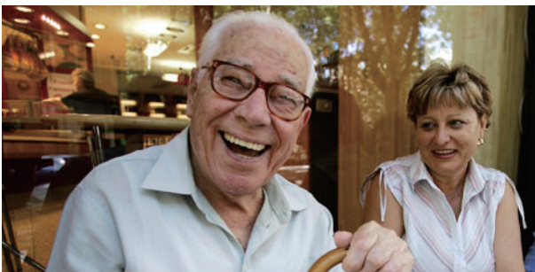
圖一 義大利97歲老人與其48歲的烏克蘭籍看護

人口快速老化是目前開發中以及已開發世界共同面對的嚴峻挑戰，在社會價值迅速由集體意識轉向個人主義的趨勢下，老人的照顧責任很難完全由家庭來承擔。早在1960年代，美國社會學家Burgess、Locke與Thomas (1963) 就提出家庭不再是制度，而是一種情感支持與友誼陪伴關係的說法；英國社會學家Giddens (2000) 則認為家庭仍存在於現代社會，但其實質內容已經轉變，現代的婚姻與家庭已經變成是個舊瓶新裝的外殼機構 (shell institution)；同時，日本人口學家Ogawa在1990年代的研究中就曾預言，要將照顧老人的責任回歸家庭是不太可能成功的。因為傳統上養老育幼是家庭的責任，也是女人的責任。而女人的社會地位與其預期角色一旦改變，尤其是在男女性別角色趨於平等的社會，養老的責任就很難回歸到家庭 (或女性家人) 來承擔。而在老人比較喜歡在自家養老的價值觀下，雇用工資較為低廉的外籍看護工以提供全天候照顧就會是優先選項，未來如何規範外籍看護工與雇主間這種「情感性關懷」的勞雇關係便是相當重要的政策制訂要素。