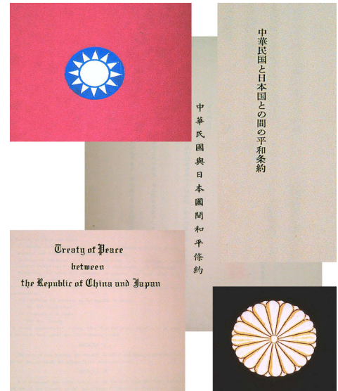
附圖 2：我們的所有權狀—現存外交部的約文原本

國際法上因為國際戰爭造成的領土移轉須經過領土授受國家和平條約簽訂，勝利者才能取得合法有效統治。1895 年清朝對日本在甲午戰爭戰敗後簽訂的馬關條約即為講和條約。二次大戰中勝利的中華民國與戰敗的日本國間的和平條約—中日和約，一直到 1952 年 4 月 28 日才依照舊金山和約而在臺北賓館簽訂。(見附圖) 舊金山和約第 2 條要求日本放棄韓國(條約中稱「高麗」)、臺澎、千島列島、南極地區、南沙群島之一切權利、權利名義與要求。舊金山和約第 4 條也規定日本與放棄各地間之行政當局商訂特別處理辦法。韓國與日本的正式和約於 1965 年簽訂、生效。而 1952 年的中日和約之所以趕在 1952 年 4 月 28 日舊金山和約生效之前 7 小時簽字，是因為冷戰之故，此一簽字成為美國同意舊金山和約生效，使日本恢復主權的前提條件。中日和約約文第 2 條表達其與舊金山和約的子法與母法關係：「茲承認依照」舊金山和約第 2 條。該條所說的「一切權利、權利名義與要求」，一定要回到馬關條約第 2 及第 5 條，才知道是有關臺澎領土、人民的完全主權。中日和約 1952 年 8 月 5 日生效之時，也是臺澎領土法律上變更及在臺灣之中華民國主權確立之時。