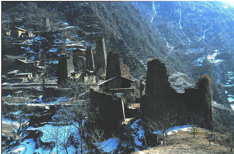
羌族建在山崖上的村寨與防衛性碉樓，顯示過去人群間資源競爭之險惡。

我們看看這個人類歷史過程。華夏認同形成於東周，在秦漢時華夏建立起統一的大帝國，以此政治體維護、擴張及分配其資源。漢代華夏帝國的西方邊緣已擴張至青藏高原東緣，也就是前面說的皺折地帶。漢代人稱這整個西方華夏邊緣帶上的部落人群為“羌”。西元 7 世紀，吐蕃興起於藏南，由此往北、往東推進，也將青藏高原東緣納入此王國勢力範圍內。吐蕃王國解體後，一個更穩固的宗教文化體在青藏高原上形成；這個宗教文化體便是今日藏族的前身，其東方邊緣也就是青藏高原東緣的高山縱谷地帶。古藏人稱此地帶為“康”。相對於藏區“核心”之雅魯藏布江河谷的衛藏，康在藏文中有“邊緣”的意思。也就是說，約從 10-12 世紀開始，青藏高原東緣皺折地帶之地與人成為漢、藏雙方的邊緣。