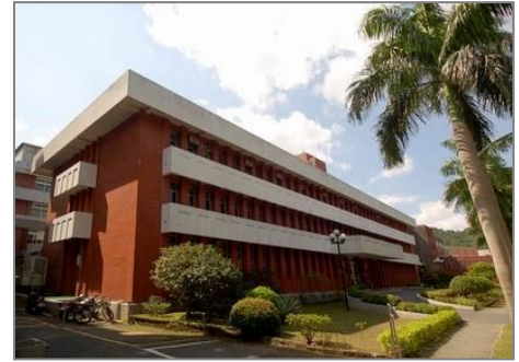
人文社會科學研究中心

駐警隊在大門車輛管制過程中，確實經常有訪客反映，分辨不清本院之人文社會科學研究中心（人社中心）與人文社會科學館（人文館）名稱與位置。為此，本組已著手辦理相關路口之路標修正作業，配合「人文社會科學館」各單位之進駐，作全院相關指標系統的更正工程發包；標示在「人文社會科學館」內者有：社會學研究所、臺灣史研究所、語言學研究所、政治學研究所籌備處、法律學研究所籌備處、應用科學研究中心、環境變遷研究中心、人文社會科學聯合圖書館等單位。