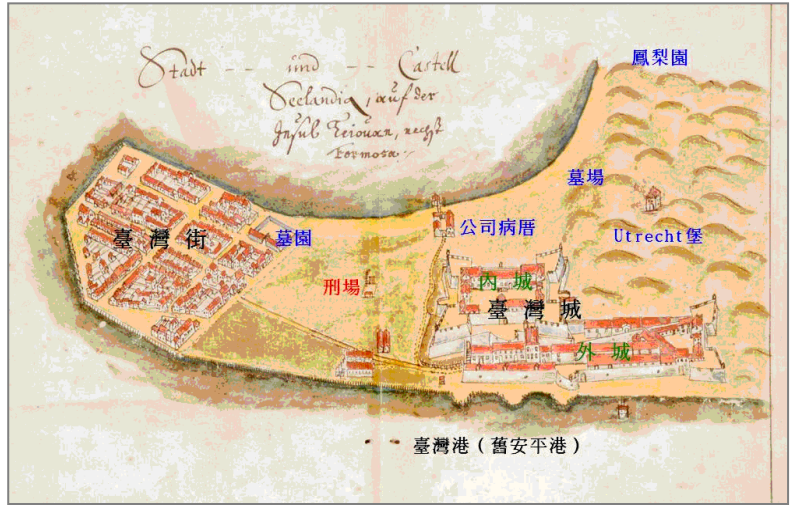
圖一：荷蘭時代臺南安平地區圖

常常受制於大明中國閩粵官員或「海盜」，說成營運或轉運中心，多少有點勉強。臺灣公司的轉口外貿輝煌時間，恐怕不超過十年。公司的利潤，反而不少是來自臺灣本地的產業與稅收。其中，蔗糖與鹿皮為公司賺進大量外匯，相信讀者都知道。米穀也一樣，雖然前輩學者中村孝志懷疑米產量是否足於外銷，但當時文獻，如揆一等人《被遺誤的臺灣》一書，確實指出臺灣大量生產米、糖，不僅供給臺灣本島，亦外銷到東南亞等地。也許，你在《臺灣城（熱蘭遮城）日誌》中譯本看不到臺灣米穀逐年出口的紀錄，反而常見進口米，以解決本地糧荒。這就引出臺灣史研究應該要再面對的老朽議題：文獻紀錄如何批判運用。