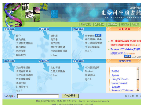
圖 2 生圖目前之網頁風貌