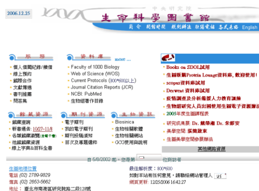
圖 1 生圖早期自行建置之網頁

我們深切地覺得，隨著資訊電子化時代的來臨，網站與網頁已成為我們與讀者溝通最重要的管道；生圖館的網頁就如同我們對讀者服務的態度及精神一樣，貼心之餘，更加注了所有館員的專業及努力！藉由此次得獎的機會，期許生命科