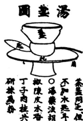
圖 1 小叢林清規 無著道忠著（1653-1745）

在這裡要對「湯藥」做一點說明，從唐代開始，飲茶之風並盛於南北，同一時期，社會上也流行著養生的湯藥——它和今日台灣街頭巷尾賣的「地骨露」、「仙草茶」等藥草茶頗為相近，主要是用植物性的藥材沖泡或熬煮的飲料。在唐代的文獻中，它被稱為「藥」，和茶合稱「茶藥」；五代時期開始稱為「湯藥」，宋代則多單稱「湯」，和茶合稱「茶湯」。禪宗清規中有很多關於「茶湯」的敘述，歷來學者多將它單解為「茶」，而沒有注