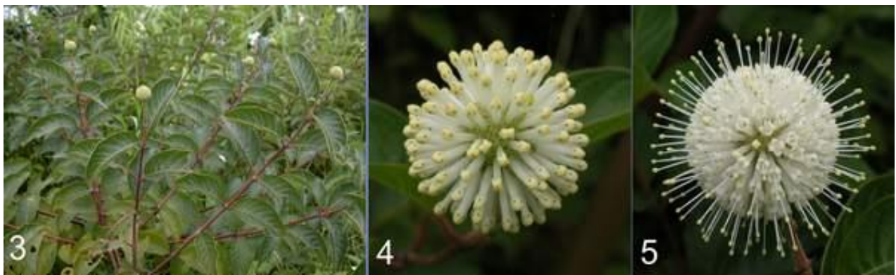
圖 1, 2: 水茄苳 Freshwater mangrove; 1 結果 fruiting (20030114); 2 總狀花序 flowering raceme (19940829 於台大)