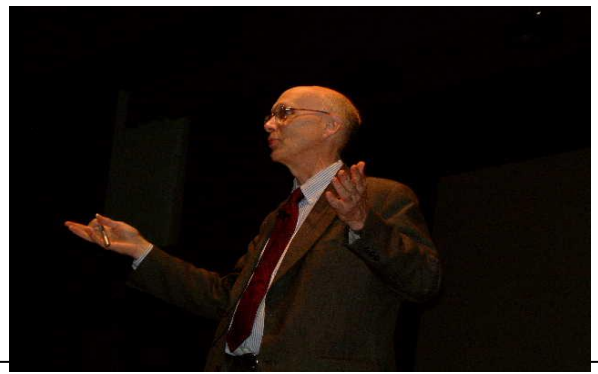
George M. Whitesides 教授的演講神態