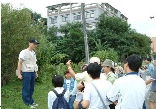
生態池志工為參觀民眾解說