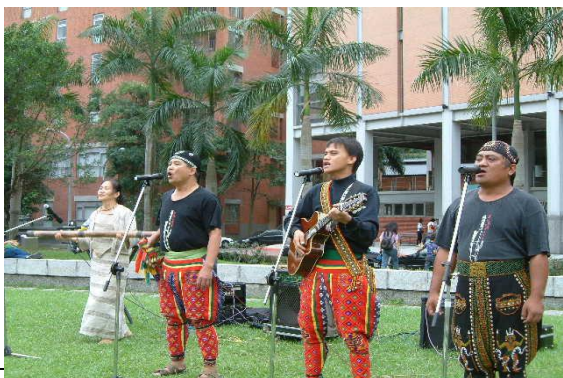
飛魚雲豹音樂工團的精彩演出