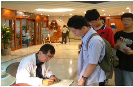
院長為高中生簽名