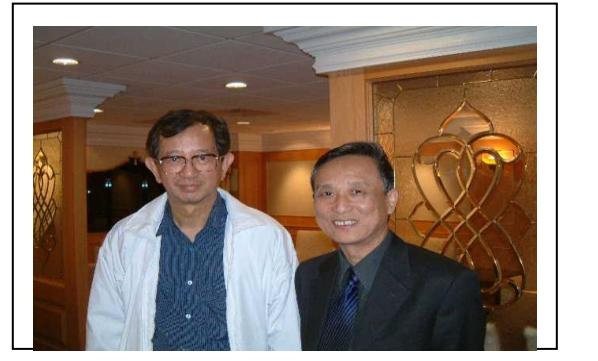
院長與 2000 年諾貝爾文學獎得主高行健先生合影