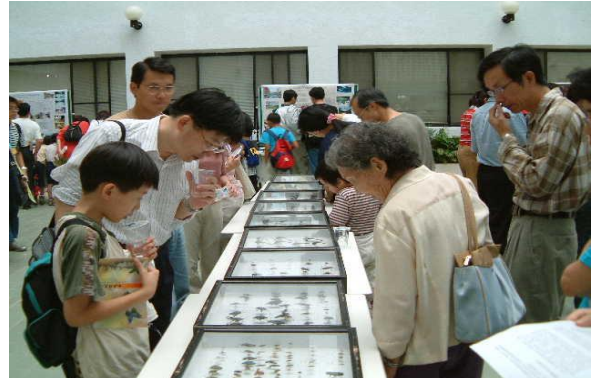
民眾參觀動物所的昆蟲標本