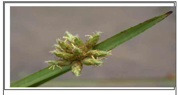
水毛花 Roughseed bulrush 花序近照 Inflorescence