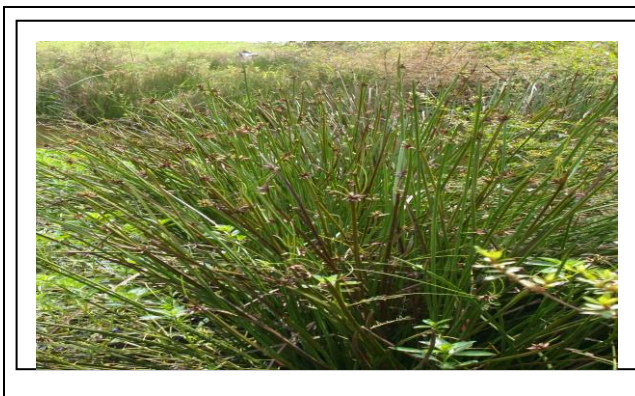
水毛花 Roughseed bulrush