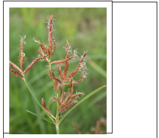
香附子 Purple nutsedge 花序, 有白色長花柱。with white, long styles