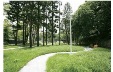
胡適公園-自由曲線的杉林小徑，隱喻胡適先生感性思想