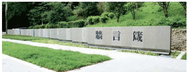
胡適公園-箴言真跡數位化、思想抽象轉化為具體，彰顯胡適先生的精神與思想