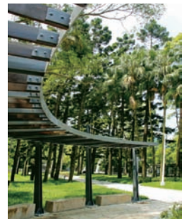
胡適公園-杉林廣場新風貌，呈現墓園公園化，公園主題化