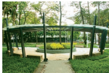
胡適公園-杉林廣場新風貌，呈現墓園公園化，公園主題化