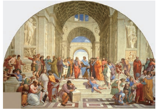
[圖一：Raphael's "School of Athens", 1505]

希臘哲學家柏拉圖的《米諾篇》（Meno）記載著這麼一個故事：米諾問蘇格拉底什麼是知識的來源，他提出了一個令人困惑的矛盾：我們如果對一個問題沒有任何的認識，那麼我們一開始要如何獲得對那個問題的知識。簡單地說，人如何獲得超出自己知識範圍的知識？蘇格拉底的回答更耐人尋味。他認為知識是與生俱來的，而且是上輩子就擁有的（古希臘人當時想必還相信轉世的說法）。因此，人的知識並不是靠後天獲得的，而是對前世已知事物的回想（recollection）（這跟中國人說的孟婆湯有異曲同工之妙）。說著說著，他叫住米諾身旁的奴隸，並且跟他說明一個簡單的數學幾何問題。那個奴隸沒有受過任何教育，更別提有一丁點數學知識，但是那個奴隸卻可以輕易理解那個幾何問題。米諾因此堅信蘇格拉底的想法是正確的。