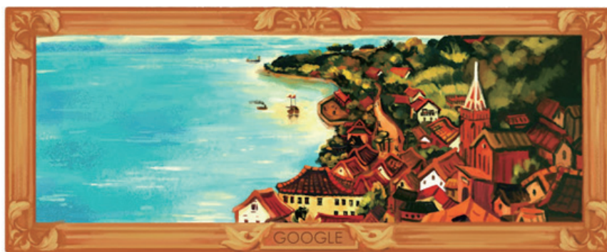
2015年2月2日臺灣Google首頁插畫紀念陳澄波 120 歲冥誕

臺灣Google在今年（2015）二月二日，推出了陳澄波（1895-1947）120歲冥誕的紀念插畫，這應該是臺灣籍畫家作品登上Google首頁的第一次。在這一天，相信有數十（百？）萬人透過Google首頁這幅以陳澄波名作《淡水夕照》為主題的插畫，認識了這位在臺灣史上佔有一席之地的前輩畫家，也成為許多新聞媒體與網站紛紛傳頌報導的佳話。Google首頁出現後，有許多人好奇的詢問陳澄波基金會與臺史所，花了多少錢才能有這好的露出（廣告宣傳）機會？答案是一毛錢也不必花！或者，真正的答案是，這段佳話的孕育，其實有著長達三年、甚至可說是十年以上的細火慢熬，難計成本。