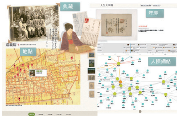
「從北緯23.5°出發 陳澄波」主題網站截圖

陳澄波數位典藏資料多元、豐富的特色，也造就了一個主題網站「從北緯23.5°出發 陳澄波」（ http://chenchengpo.asdc.sinica.edu.tw ）的誕生，這是目前國內外少見的，完整呈現一位藝術家多元面貌，並初步運用數位人文學研究成果的線上特展。這個主題網站有中英雙語版本，由本院數位文化中心同仁策劃，臺史所及陳澄波文化基金會協辦，結合地圖、網絡關係、互動式年表等資料視覺化技術，進一步用圖像全面性地串起陳澄波的個人生平、藝術成就、環境變遷與社會關係。網站推出後獲「故事：寫給所有人的歷史」（ http://gushi.tw/ ）以及許多支持者於社交媒體主動轉載推薦，在陳澄波畫作實體展覽結束後，這個線上虛擬展覽仍持續作為一個探索學習的重要媒介。