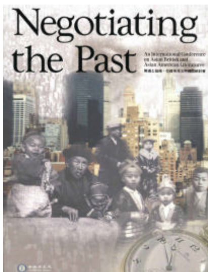
圖一：與過去協商：亞裔英美文學國際研討會

根，並尋求國際與本土的接軌，盡力呈現具有特色的學術成果，多年來在文學的多元文化研究方面已有令國內、外人士矚目的成績，不僅帶動國內學術風氣，並且得到國際的肯定。今後將在既有的良好基礎上，繼續以團隊的力量，發揮研究專長，進一步為國內、外的相關研究開拓領域，再創佳績。